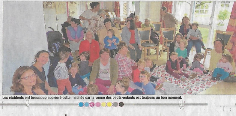
Les résidents ont beaucoup apprécié cette matinée car la venue des petits-enfants est toujours un bon moment.